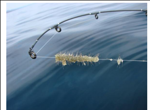
Figure 3. Amas de puces d'eau sur une ligne à pêche

Lorsque le cladocère épineux et la puce d'eau en hameçon sont abondants, la consommation importante du plancton par ceux-ci diminue la quantité de nourriture